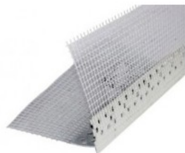
Photos avec baguettes d'angles